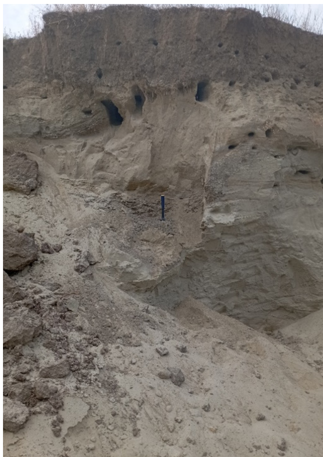
Figura 4. Situl Gura Galbenei IV cu poziționarea stratului de prundiș, unde au fost descoperite resturi fosile de vertebrate

(aprox 700 kg). Un aspect comun cu situl Gura Galbenei III este prezența a numeroase resturi fosile de pești, reptile și amfibii reprezentate prin dentiție, vertebre etc.