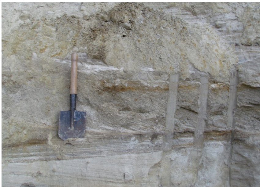
Figura 2. Lentila de nisip aluvial din situl Gura Galbenei II

Un alt punct fosilifer descoperit în 2011 (Gura Galbenei III), este amplasat în partea de Nord a localității (intravilan), pe versantul drept al r. Galbena, la o altitudine absolută de 145 m (la fel altitudinea absolută în urma precizărilor a fost modificată) ( 46^{\circ}42'38.3''N 28^{\circ}41'42.7''E ), într-o carieră neautorizată de nisip, rezultată în urma unei alunecări de teren (Fig. 3).