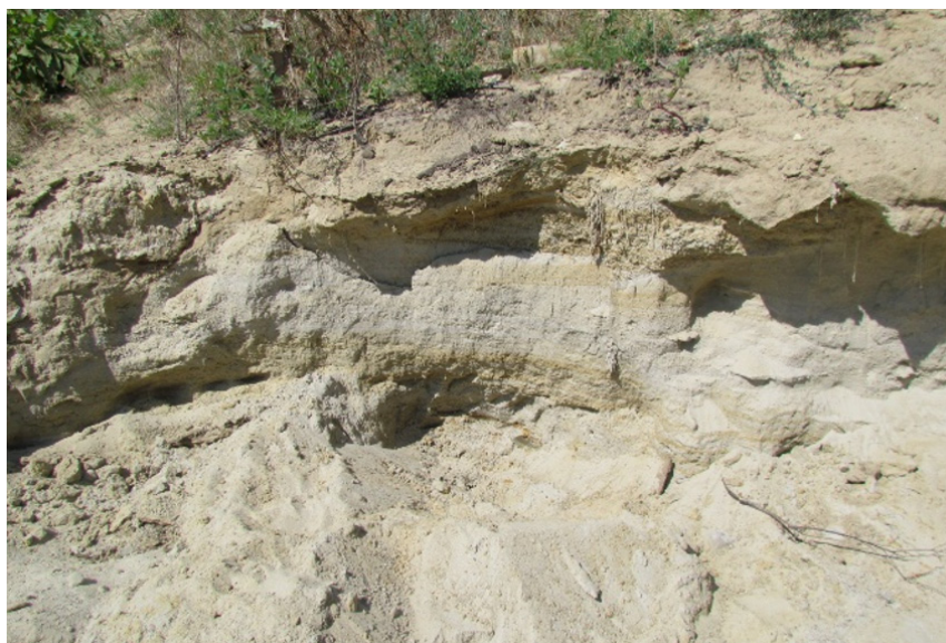
Figura 3. Lentila cu nisip și prundiș din situl Gura Galbenei III

Un alt punct fosilifer descoperit în 2011 (Gura Galbenei III), este amplasat în partea de Nord a localității (intravilan), pe versantul drept al r. Galbena, la o altitudine absolută de 145 m (la fel altitudinea absolută în urma precizărilor a fost modificată) ( 46^{\circ}42'38.3''N 28^{\circ}41'42.7''E ), într-o carieră neautorizată de nisip, rezultată în urma unei alunecări de teren (Fig. 3).