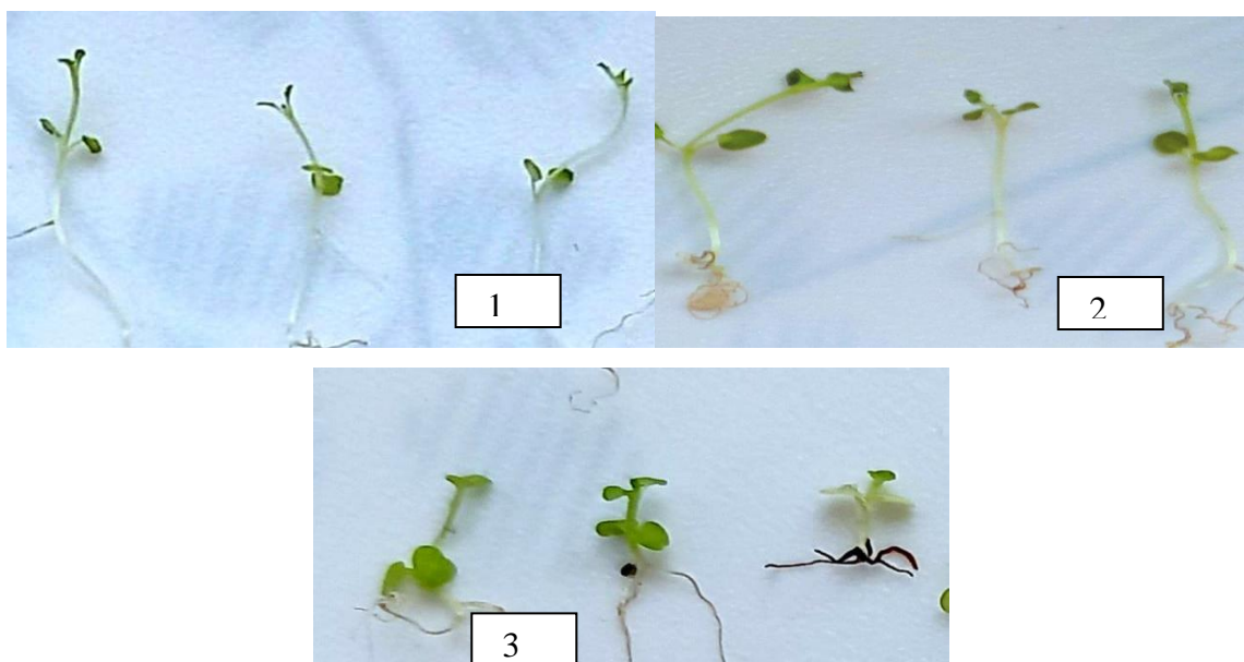
Fig.3. Plantule de mentă după 15 zile de la germinare 1 – administrarea biostimulatorului S22 ( Calothrix marchica ); 2 – administrarea biostimulatorului S11 ( Spirulina platensis ); 3 – proba de referință (imagine mărită).

După cum demonstrează datele experimentale obținute, putem afirma că vizibil este o diferență vădită între proba martor și probele experimentale. Astfel, lungimea plantulelor obținute în urma germinării semințelor de mentă cu adaos de stimulatori atinge valori mai înalte, și anume: 20,3 și 20,0 mm, respectiv, comparativ cu valorile martorului (9,4 mm).