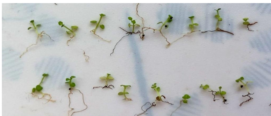
Fig.4. Plantule de mentă după 15 zile de la germinare, varianta martor.