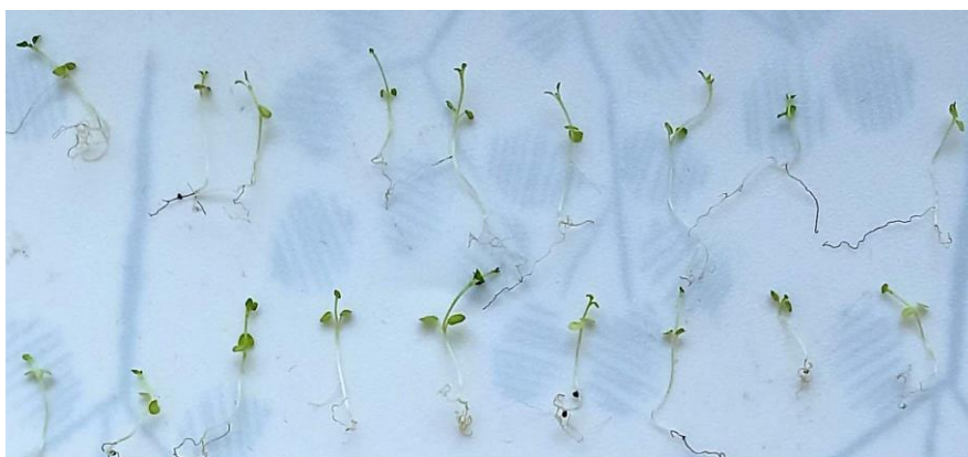
Fig.5. Plantule de mentă după 15 zile de la germinare, varianta cu administrarea S11 obținut în baza filtratului rezultat de la cultivarea cianobacteriei Spirulina platensis .