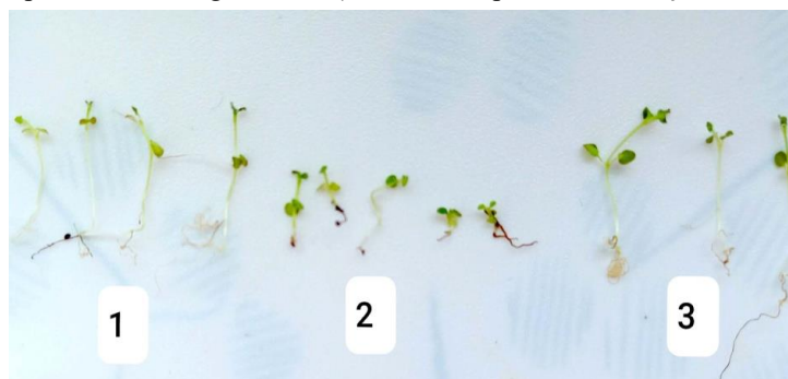
Fig.2. Plantulele de mentă după germinare cu și fără adaus de stimulatori 1 – administrarea stimulatorului S11, 2 – martor, 3 – administrarea stimulatorului S22.