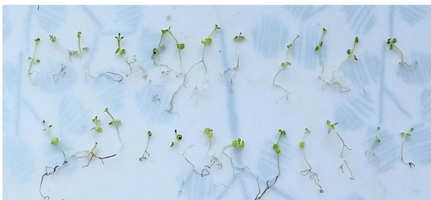
Fig.6. Plantule de mentă după 15 zile de la germinare, varianta cu administrarea S22 obținut în baza filtratului rezultat de la cultivarea cianobacteriei Calothrix marchica .

În rezultatul cercetărilor au fost înregistrate efecte pozitive asupra dezvoltării plantulelor după 15 zile de la germinare, lungimea medie a tulpiniței și a rădăcinii plantulelor de mentă la suplینirea stimulatorilor fiind de 2,13 ori (S11) și de 2,16 ori (S22) și, respectiv, de 2,03 și de 2,19 ori mai mare, comparativ cu valorile respective la plantulele germinate fără suplینirea stimulatorilor (proba de referință) (Tab.2).