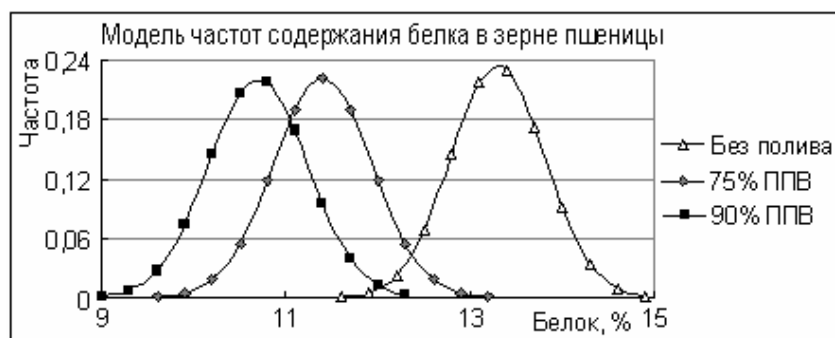
Рис.1. Влияние влажности почвы на статистическое распределение содержания белка в зерне твердой пшеницы Харьковская-46

Для получения более четкой репрезентативности экспериментально полученных данных, представленных в таблице, на основе средних величин и их среднеквадратических отклонений использован метод моделирования кривых нормального распределения по программе Эксель в приложении нормрасп . Эти данные содержания белка в зерне пшеницы представлены на рис.1, где четко видно, что семена, полученные при дефиците почвенной влаги, четко отделяются от остальных вариантов более высоким содержанием белка. Аналогичный подход, примененный к активности фермента РНКазы, представлен на рис.2. Из рисунка видно, что уровень влажности имеет прямо противоположное влияние на этот показатель. Однако семена с высокой активностью РНКазы не так четко отстоят от двух других вариантов по влажности почвы, отсюда как критерий на высокие урожайные качества семян активность РНКазы не так репрезентативна, как содержание белка.