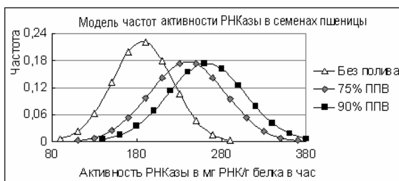
Рис.2. Влияние влажности почвы на статистическое распределение активности РНКазы в расчете на белок в зерне твердой пшеницы Харьковская-46

Из рис.1 видно, что главным фактором, определяющим содержание белка в зерне пшеницы, является уровень влажности почвы, а величины и сочетания минеральных питаний вкладываются в пределы кривых распределений, зависящих от влажности почвы. При этом, судя по кривым распределения содержания белка, уровень влажности почвы при 75% ППВ накладывается на данные избыточной влажности при 90% ППВ, и совершенно четко отстоит распределение повышенного содержания белка в зерне, репродуцированного при дефиците почвенной влаги.